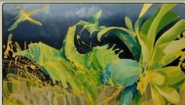
Obra de la artista plástica pampeana Jimena Cabello Óleo sobre tela

Universidad de Buenos Aires, Consejo Nacional de Investigaciones Científicas y Técnicas, Argentina