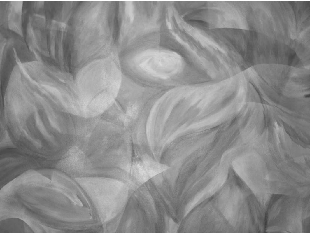
"Sinfonía naranja" , óleo Lita Beanatte