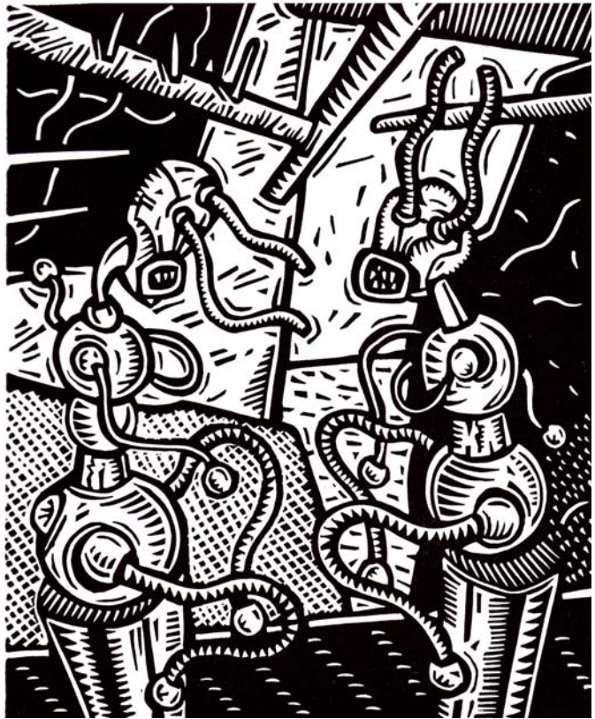
“Sin título”, xilografía José Florez Nalé

La maquinaria pedagógica produce ficciones discursivas cuyas etiquetas cognitivas aseguran que han sido fabricadas en el lugar de origen de la verdad, marcando, de este modo, la autenticidad del producto docente, producto conocimiento, producto alumno: un triángulo pedagógico que traza líneas de fuerza de un vértice a otro y que como un prisma transparente los reflejos de verdad que descompone en cosas, en otros, en nosotros. El pensamiento basado en el signo binario subyace en este modelo pedagógico que supone que la escritura es un código o alfabeto que nos sirve para transmitir, intercambiar y comunicarnos. Sin embargo, lejos del efecto tranquilizador de esta distinción, las ideas hasta aquí expuestas nos inquietan, al punto de volverse insoportables, quizás... porque percibimos que el pensar desarrollado bajo el amparo de una lógica que conjuga signo y escritura en un binarismo donde prevalece la verdad que debe ser transmitida, languidece a riesgo de convertirse en un residuo cadavérico porque ya nada nos moviliza. Un libro-experiencia, muy probablemente, necesite de una escuela insoportable, es decir, una escuela entendida como uno de los simulacros más poderosos y reales que ha creado la modernidad. Una ficción, por lo tanto, posible de ser reinventada y recreada en una transmisión que no imponga interpretaciones y que abra el juego para la transformación en la experiencia.