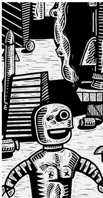
Detalle obra "Sin título" José Florez Nalé