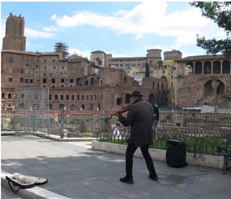
Miré los muros , fotografía, Patricia Bonjour

Esta investigación concluye que es necesario que los colegios abran espacios pedagógicos orientados hacia la formación del apoderado, en este caso escuela para padres.