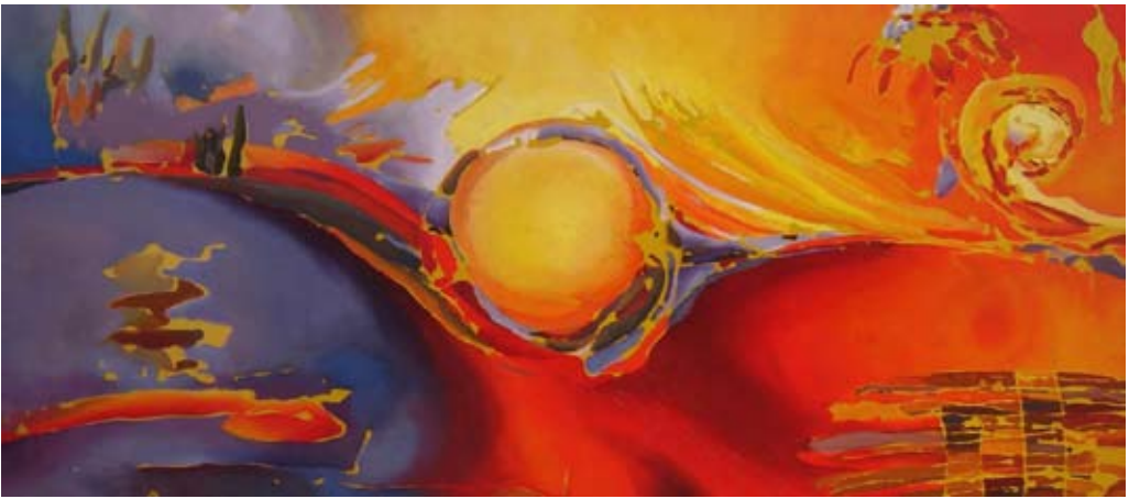
"Sol naciente" , óleo. Jimena Cabello