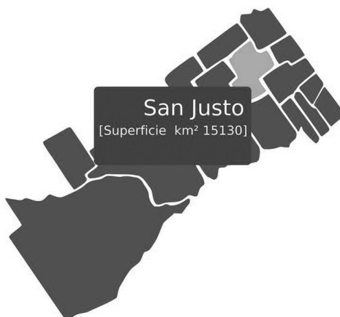
Figura 1: Localidad de San Justo, su ubicación dentro del Partido de La Matanza