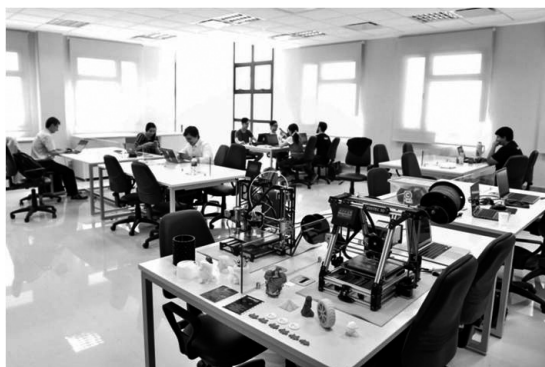
Figura 7: CeDIT