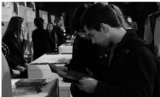
Figura 5: Feria Educativa