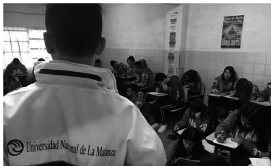
Figura 3. Encuentro en el marco del Programa La UNLaM va a tu escuela