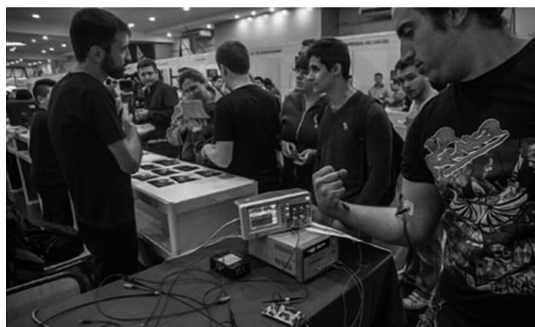
Figura 6. Expo proyecto