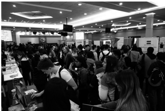
Figura 4: Feria Expo-Empleo