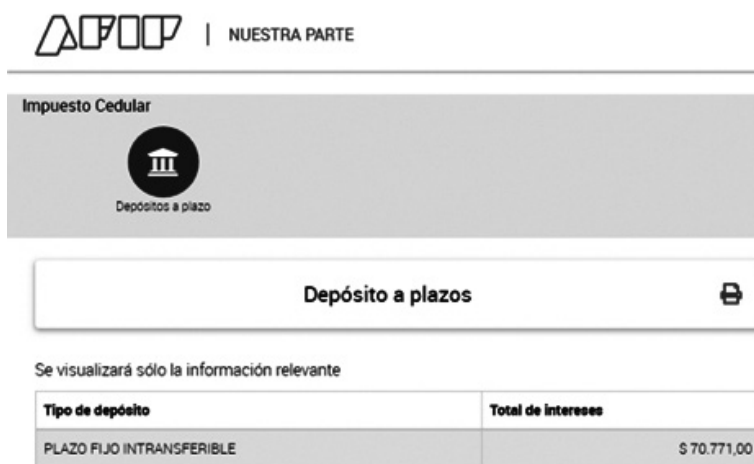
Gráfico 3. “Nuestra Parte”: ejemplo