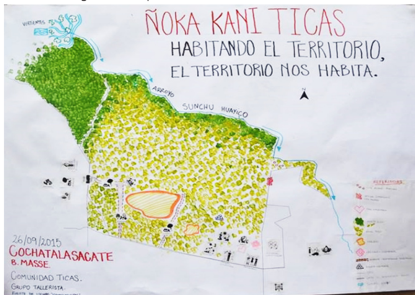
Figura Nº 2. Mapa colaborativo del territorio Cochatalasacate