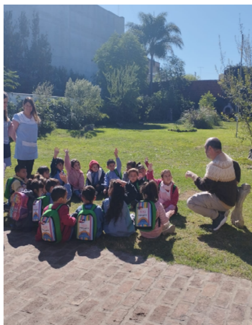
Figura 5. Arriba: Puertas abiertas durante la XX Semana Nacional de la Ciencia y la Tecnología. Abajo: Reconocimiento público de la municipalidad a los empleados del Museo por el renovado compromiso de la institución con el público escolar a lo largo del año 2022. Disponible en: https://www.facebook.com/photo/?fbid=688082169658326&set=a.215532546913293