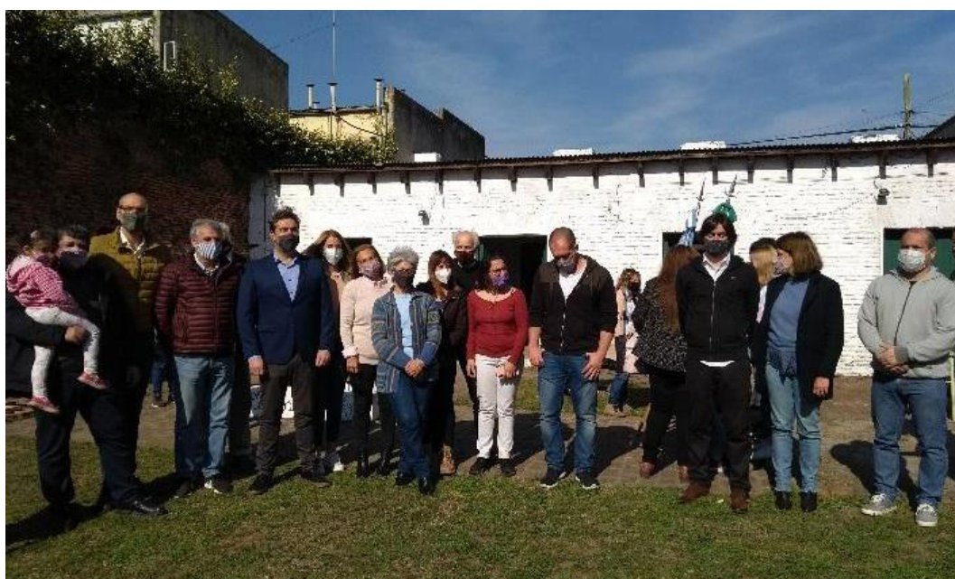
Figura 3. Promoción de actividades virtuales y presenciales durante 2021. Arriba: Charla virtual "Un aventurero, un científico, un masón. Francisco Javier Muñiz. Abajo: Acto de nombramiento de Florentino Ameghino como Ciudadano Ilustre, por parte de la Municipalidad de Luján.