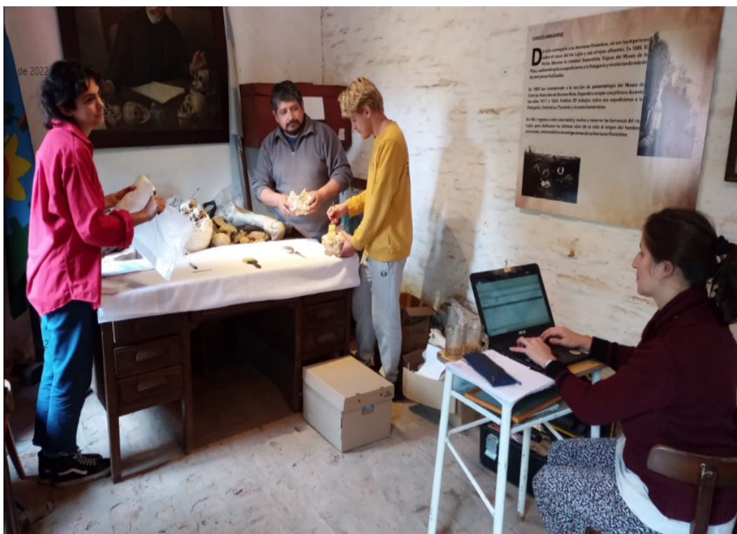
Figura 4. Promoción de actividades presenciales durante 2022. Arriba: Jornada de Difusión sobre arqueología y paleontología en el mes aniversario de nacimiento de Florentino Ameghino. Abajo: Trabajo de sistematización de colecciones.