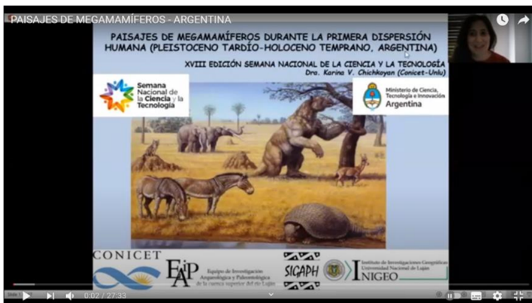
Figura 2. Promoción de actividades virtuales durante 2020. Arriba: Charla en el marco de la Jornada de Divulgación en el mes aniversario del nacimiento de Florentino Ameghino. Abajo: Charla en el marco de la XVIII Semana Nacional de la Ciencia y la Técnica.

Durante los primeros meses del año 2021 se continuaron las actividades de manera virtual, pero a mediados del mismo año se pudo retomar la presencialidad. Realizamos las siguientes acciones: