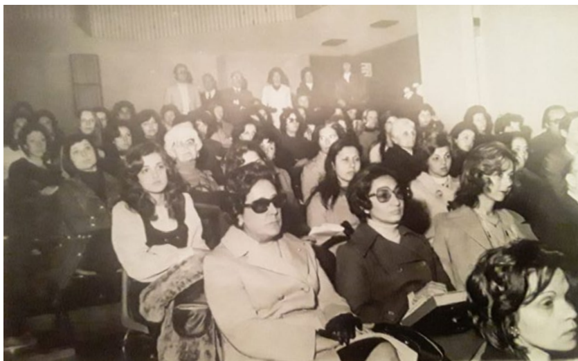
Foto tomada el 18 de septiembre de 1974 en el marco del III SNEC.