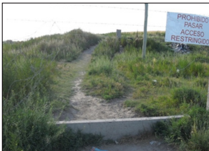
Imagen 2: PRÁCTICA MATERIAL DE CONTROL DEL ESPACIO.