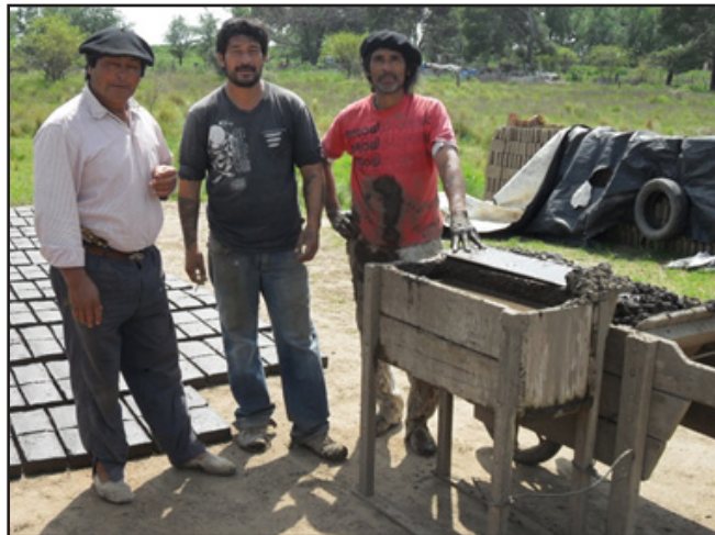
Imagen 1: HORNEROS DE 'NUEVO AMANECER'