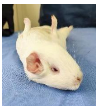
Fig 2. Reflejo de enderezamiento (righting reflex) negativo en cobayos ( Cavia porcellus ) tras la administración de medetomidina (100 µg/kg) en el punto de acupuntura GV20.