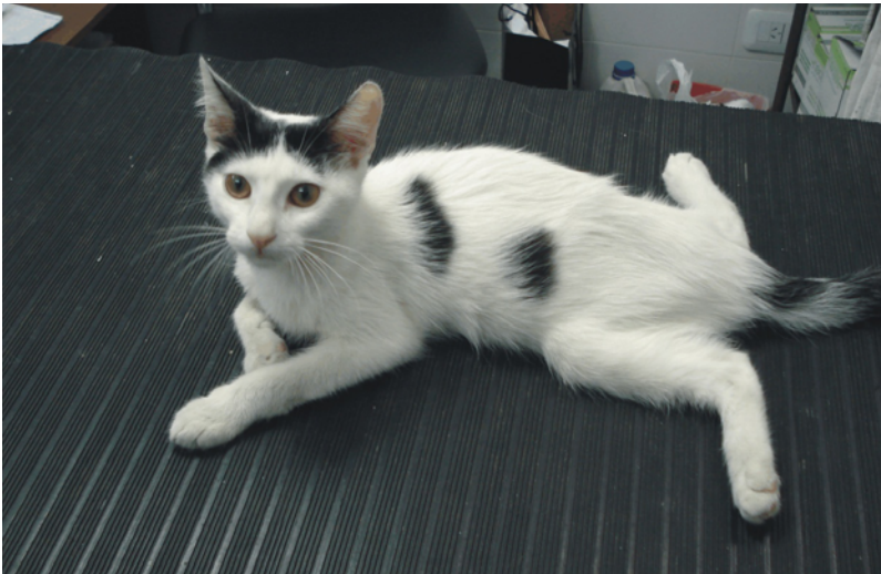
Figura 1: Gato de 6 meses de edad con paraparesia, proveniente de una zona rural de la Provincia de Buenos Aires (Argentina), con sospecha de mielopatía por Gurltia paralysans .

Los gatos afectados presentan signos típicos de una mielopatía crónica, que resultan de la compresión de la sustancia blanca, principalmente del cordón dorsal de la zona toracolumbar y lumbosacra, ocasionada por la proliferación vascular producida por el parásito. Los signos clínicos se inician con la caída de la cola, que nunca vuelve a permanecer erecta, independientemente del humor del gato, atribuido a la disminución del tono muscular de los músculos de la cola. Después de 1 a 3 meses de evolución se observa una ataxia marcada que evoluciona a una paraparesia moderada a grave luego a los 5 o 6 meses (Figura 1), con apoyo plantígrado y "marcha de conejo". Luego de 12 a 18 meses de evolución se observa una paraparesia grave, casi no ambulatoria, atrofia muscular severa, disminución o ausencia de reflejos espinales y, en algunos casos, atonía vesical (Togni et al. 2013).