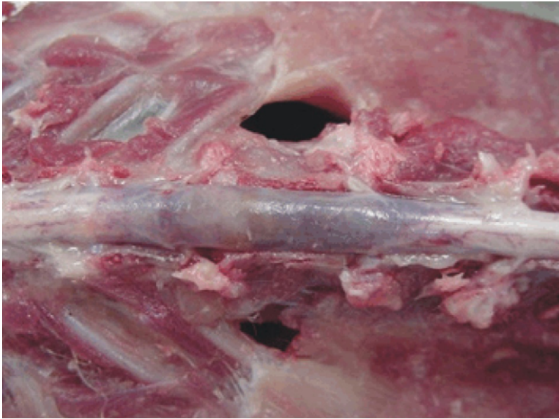
Figura 2: B. Presencia del parásito adulto en la luz de un vaso espinal submeníngeo, con manguitos perivasculares a predominio linfocitario.

La presencia del parásito y su migración producen trastornos circulatorios (hemorragia, congestión e hiperemia) e inflamatorios asociados (manguitos perivasculares con infiltración linfocitaria crónica), principalmente en la sustancia blanca (Alzate Gómez et al. 2011; Rivero et al. 2011; Aguirre Carmona 2013; Togni et al. 2013). Los vasos sanguíneos se encuentran sinuosos y dilatados, con presencia de trombos asociados; se observan alteraciones compensatorias tales como hipertrofia de la túnica media e hiperplasia de la adventicia y alteraciones reparadoras, como fleboesclerosis. La lesión vascular se presenta como una dilatación venosa (várice venular), que probablemente ocurre a consecuencia de la obstrucción provocada por la presencia del parásito, que resulta en éstasis sanguíneo y aumento de la presión vascular (Togni et al. 2013). Los parásitos en los vasos sanguíneos, asociados a los trombos y a la isquemia, causan necrosis del tejido medular subyacente (Togni et al. 2013). Los segmentos medulares más afectados son los lumbares y lumbosacros, con menor compromiso de los torácicos (Alzate Gómez et al. 2011; Gómez et al. 2010; Guerrero et al. 2011; Moroni et al. 2011; Rivero et al. 2011; Togni et al. 2013). No existen comunicaciones