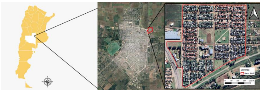
Figura 1. Lugar donde se desarrolló el trabajo. Ubicación de Santa Rosa, La Pampa, Argentina (izquierda); y mapa satelital del barrio Santa María de las Pampas, extraído y modificado de Google Maps (derecha).

En cuanto al barrio, se encuentra ubicado al Noreste de la capital pampeana (Figura 1), delimitado al norte por la calle Guillermo Estevez Boero, al sur por la avenida Víctor Arriaga, al oeste por la avenida Circunvalación Santiago Marzo (NE) y al este por la calle Tello Norte. Fue inaugurado el 3 de octubre de 2007 y cuenta con cuatro instituciones educativas, dos espacios verdes y 29 manzanas en las que se distribuyen 533 viviendas, con un número aproximado de 2132 habitantes.