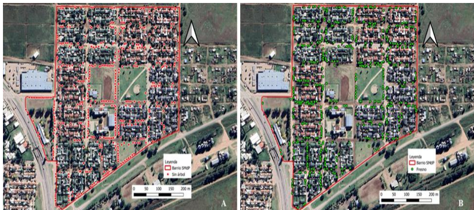
Figura 2. Distribución del arbolado en el barrio Santa María de las Pampas (Santa Rosa, La Pampa, Argentina). A) Los puntos rojos muestran los sitios no ocupados por ejemplares, B) Los puntos verdes muestran los sitios ocupados por ejemplares de fresnos ( Fraxinus spp.).

El censo del arbolado urbano del barrio registró 1282 sitios potenciales de ser ocupados por árboles, de los cuales 438 no cuentan con ejemplares (Figura 2, A), lo que representa un 34,2 % del total. En los 844 espacios restantes se contabilizaron especies exóticas tales como: fresnos, ligustros, arces, paraísos, sauces, moras, plátanos y espumillas (Tabla 1). Fue marcada la predominancia de fresnos, que con 484 ejemplares representó el 57,3 % del total censado, siendo el taxón prevaleciente en uno de los dos espacios verdes del barrio, como también en numerosas cuadras (Figura 2, B). Respecto de especies nativas se encontraron ejemplares de: caldén, algarrobos ( Neltuma spp. (Griseb.) C.E. Hughes & G.P. Lewis), jacarandá y ceibo. El 3,6 % de los ejemplares correspondió a arbustos. Cabe aclarar que en la categoría “otras” se contabilizaron ejemplares arbóreos de morera de papel ( Broussonetia papyrifera (L.) L’Hér.), acacia negra ( Gleditsia triacanthos L.) y de álamo plateado ( Populus alba L.); en tanto en la categoría “no identificable” se contabilizaron ejemplares deteriorados y/o sin hojas.