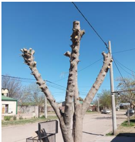
Figura 4. Arbolado del barrio Santa María de las Pampas (Santa Rosa, La Pampa, Argentina). Ejemplar con mala intervención de poda.

Figure 4. Urban tree population in the Santa María de las Pampas neighborhood (Santa Rosa, La Pampa, Argentina). Tree showing improper pruning intervention.