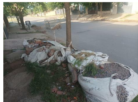
Figura 5. Arbolado del barrio Santa María de las Pampas (Santa Rosa, La Pampa, Argentina). Agresión urbana: Residuos de obra próximos a la base de un ejemplar censado.

Figure 4. Urban tree population in the Santa María de las Pampas neighborhood (Santa Rosa, La Pampa, Argentina). Tree showing improper pruning intervention.