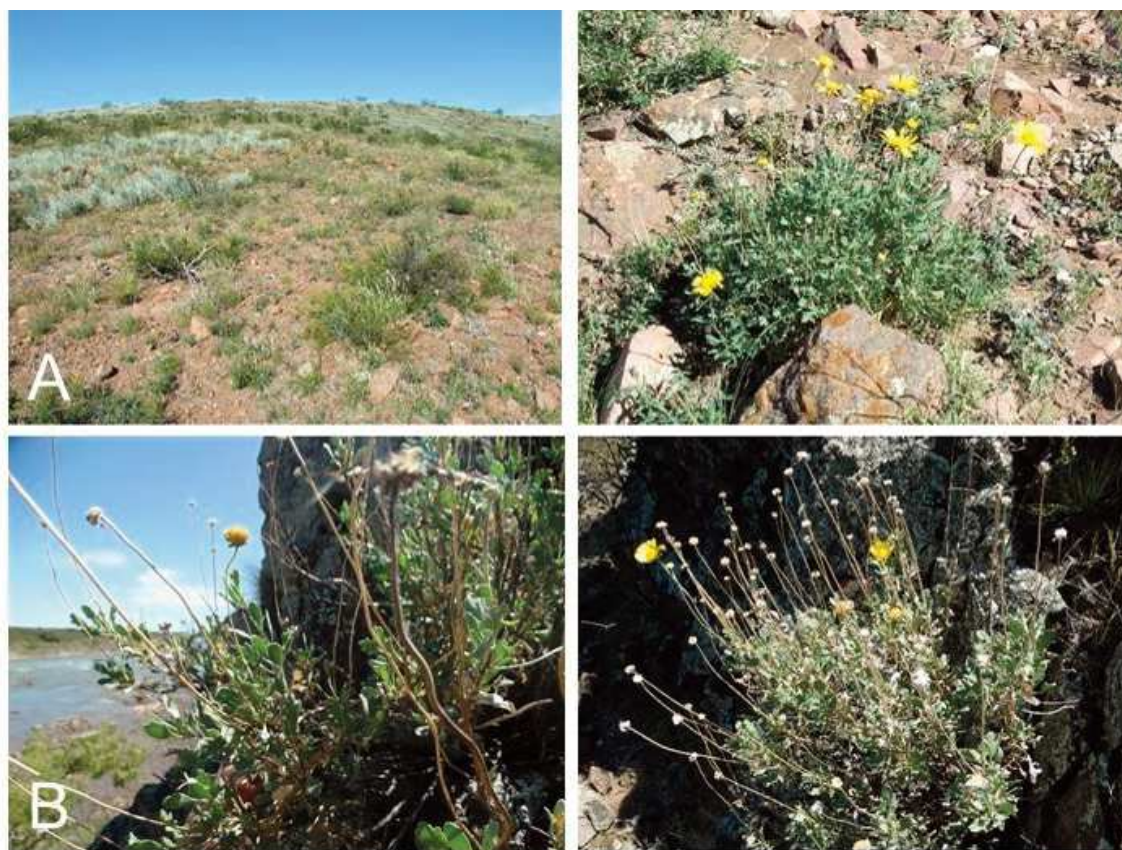
Figura 2. Nuevos hallazgos de Gaillardia cabreræ fuera del Parque Nacional Lihué Calel. A: Población de Sierras Chicas, a 10 km. al norte del área protegida. B: Población sobre los sustratos rocosos de las Sierras de Choique Mahuida, sobre la orilla del Río Colorado.

Por definición, una especie rara es una especie endémica restringida, es decir, su distribución está acotada a un área mucho menor a la que se esperaría para un taxón de su mismo