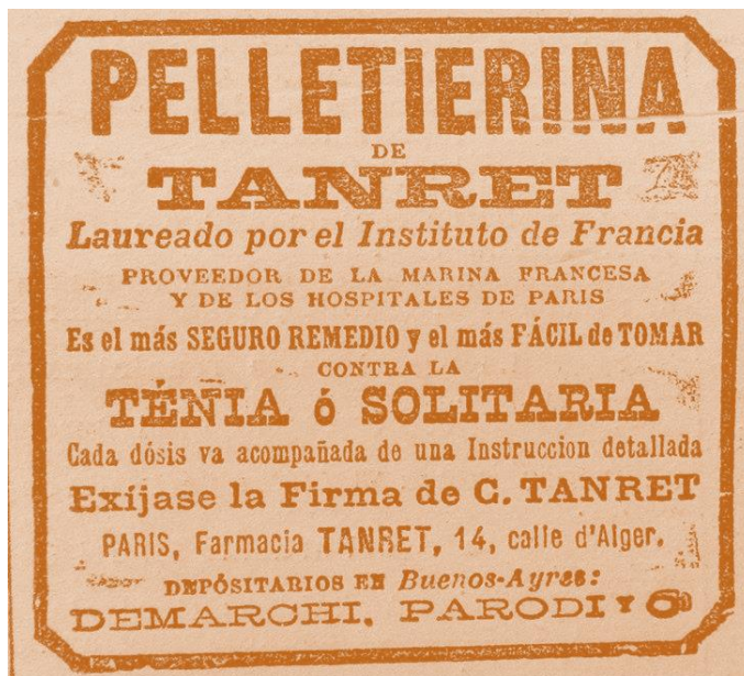
Imagen 1: Publicidad incluida en Sud-América , 10 de junio de 1891

En segundo lugar, cabría leer bajo esa misma óptica el lugar destacado que se asignaba a los consejos terapéuticos contra la teniasis en los muy populares manuales o diccionarios de medicina casera o doméstica distribuidos por esas décadas en la ciudad. Al igual que los remedios recién indicados, estos materiales de divulgación denotan la extendida costumbre de tramitar los problemas de salud sin la mediación de los facultativos (Porter, 1992; Di Liscia, 2005; Armus, 2016). En momentos en que, tal y como ya fue advertido, la biomedicina aportaba pocas soluciones curativas de eficacia comprobada, la apelación a recursos alternativos era un gesto legítimo y habitual, incluso en los habitantes de grandes ciudades o en los sectores letrados. En tal sentido, aquellos manuales invitaban