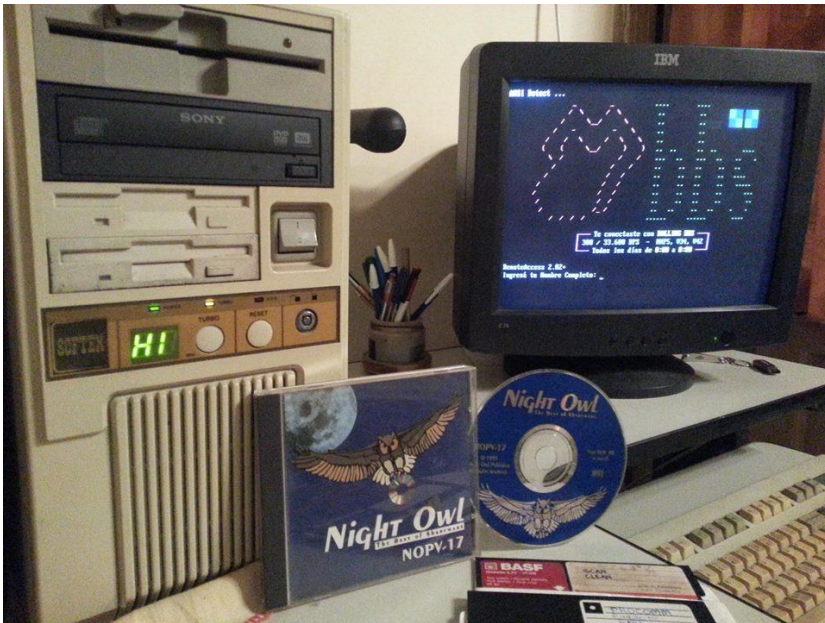
Figura 1. Hardware y software de Rolling BBS, 2018

Mi interés por la memoria corporal de saberes efímeros y no formalizables (Taylor, 2016) se gesta a partir de comprender que un hojaldre de temporalidades estructura la conversación y los intercambios de los BBS. Las tecnologías habilitaron esa matriz de significación y enfrentaron dos desafíos: transmisión y almacenamiento de datos. Desafiados por la carencia y la inestabilidad, los BBS fueron definiendo su alcance y sus reglas comunitarias al ritmo que les imponían las capas de tecnología (el ritual de conexión era prolongado y cargado de rutinas, “llenar” una pantalla de información podía tardar entre 20 y 30 segundos, “bajar” un diskette de información, más de una noche). Fue debido a que las condiciones para conectarme a uno de los BBS actualmente en funcionamiento ( Rolling BBS ) implicaban disponer de un módem y una línea de teléfono para llamar, que me vi en la obligación de “remediar” con viejas máquinas las formas de interacción de los BBS (Figuras 1, 2, 3 y 4). 6 Los requerimientos para “llamar” a Rolling BBS tensan las relaciones entre el documento y la conversación: no puedo “bajar” mensajes a mi arqueológica computadora, debo leerlos en pantalla; y en esa escena mi familiaridad con la metáfora del texto se impone a la cercanía y a las emociones de quienes conciben ese intercambio como “charla”.