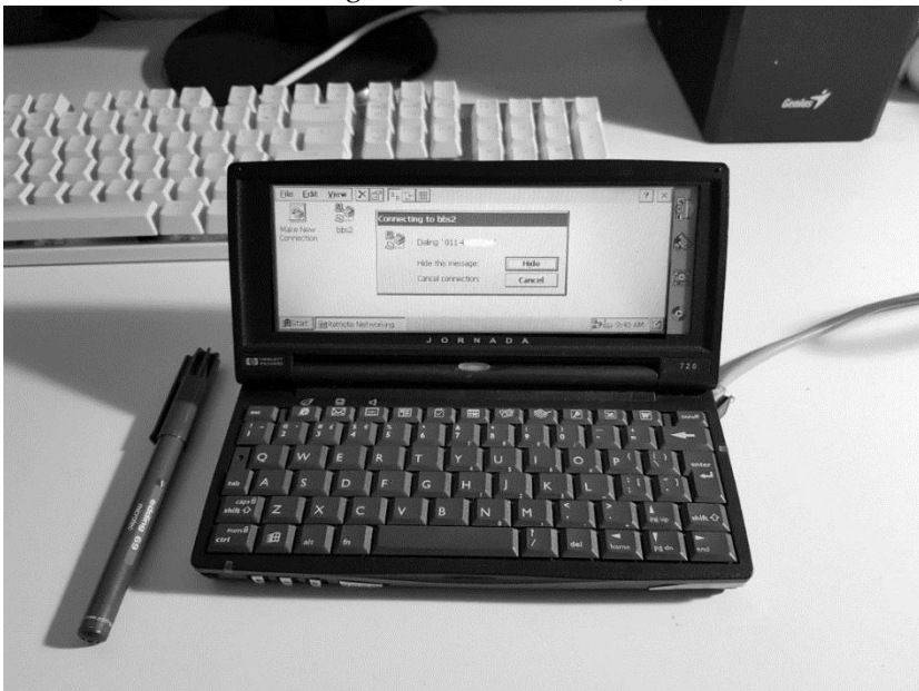
Figura 3. Conectando a Rolling BBS desde una HP Jornada 720, 2018

Sin embargo, el ruido incesante del módem en mi escritorio de trabajo todavía es extraño. Una amiga arqueóloga alivió la alteridad de esa práctica pasándome bibliografía donde se afilan piedras, se prueban movimientos de impulso y carga, donde la conjetura se sacude del hombro el polvo de la palabra escrita.