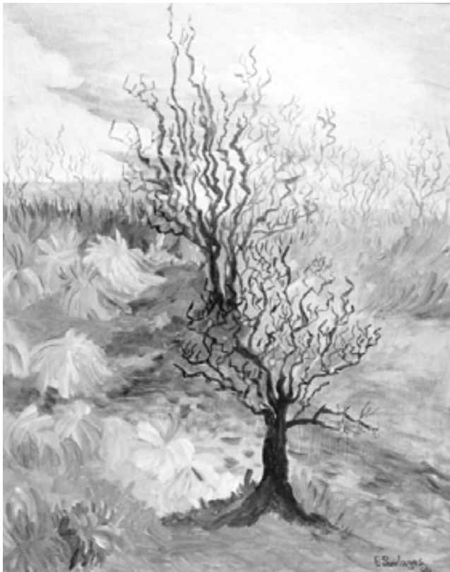
“Invierno en el medanal”, óleo Eliana Soulages de Leiva

b) Estudios sobre los currícula y las enseñanzas relativas a EpC. Otra tipología de estudios evaluativos de máxima actualidad en nuestro país es la comparación de los objetivos y contenidos (conocimientos y valores) de los currícula concretos que se pro-