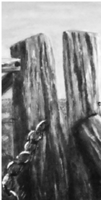
Detalle obra "Cerrada inmensidad", Lita Beanatte