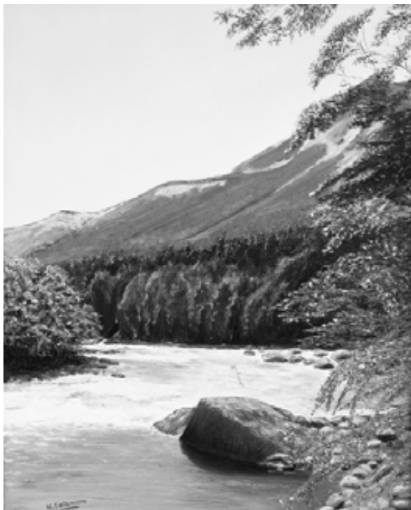
“Paisaje sureño”, óleo Néstor Salamero

acción reflexiva de todos los involucrados en la construcción del conocimiento sobre el objeto a evaluar. El reto, por tanto, es que el conocimiento se genere a través del diálogo, la deliberación y la negociación entre todos los involucrados lo que sitúa u otorgar al evaluador el papel de facilitador de los procesos de empoderamiento, promotor del dialogo y la negociación entre los implicados y gestor de la deliberación democrática . En una evaluación democrática el evaluador tiene que asumir el rol de administrador de la deliberación democrática (NacNeil, 2002). No se trata solamente de facilitar la participación de todos los involucrados en la deliberación sino también de administrar el proceso con el que todas las opiniones sean respetadas y valoradas más allá de la oportunidad o coincidencia con el sentir de la mayoría