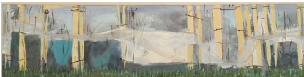
"Del color del cielo", técnica mixta. María José Pérez

Fecha de Recepción: 21 de junio de 2017 Primera Evaluación: 22 de julio de 2017 Segunda Evaluación: 25 de julio de 2017 Fecha de Aceptación: 11 de agosto de 2017