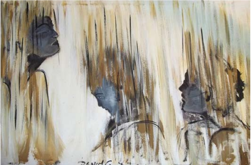
S/T, acrílico. Daniel Canitrot

Además del análisis efectuado de manera manual, se utilizó el software ATLAS.ti®, una potente herramienta para el análisis cualitativo