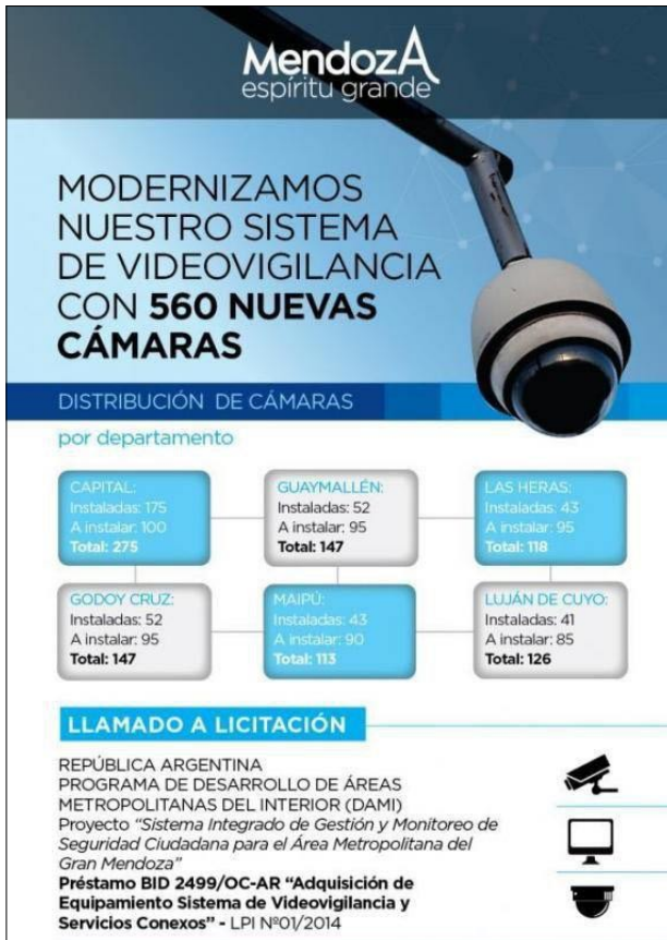
Figura N 3. Equipamiento Sistema de Videovigilancia