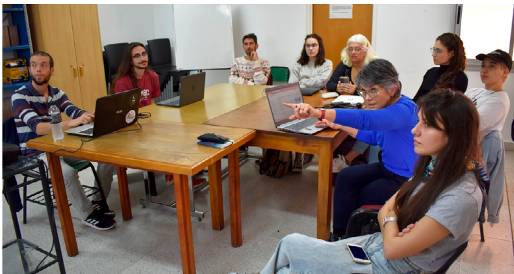
Imagen 2. Desarrollo del editatón

La duración del encuentro fue fijada en tres horas. Un número importante de participantes aportaron sus computadoras portátiles y la facultad facilitó un proyector, para poner en común los avances. Las tareas de edición se distribuyeron en grupos y se fue trabajando sobre las entradas seleccionadas. Las y los wikipedistas de mayor experiencia asistieron durante el proceso, mostrando ejemplos de resolución de problemas. Junto con los contenidos elaborados se incorporaron enlaces a entradas vinculadas, referencias de fuentes y bibliografía, así como imágenes cargadas. También se utilizó el editor de código, que permite realizar ediciones más complejas con lenguaje de marcas. Asimismo, se creó el artículo en portugués Recuperação da democracia na Argentina , mediante la herramienta de traducción asistida entre ediciones idiomáticas.