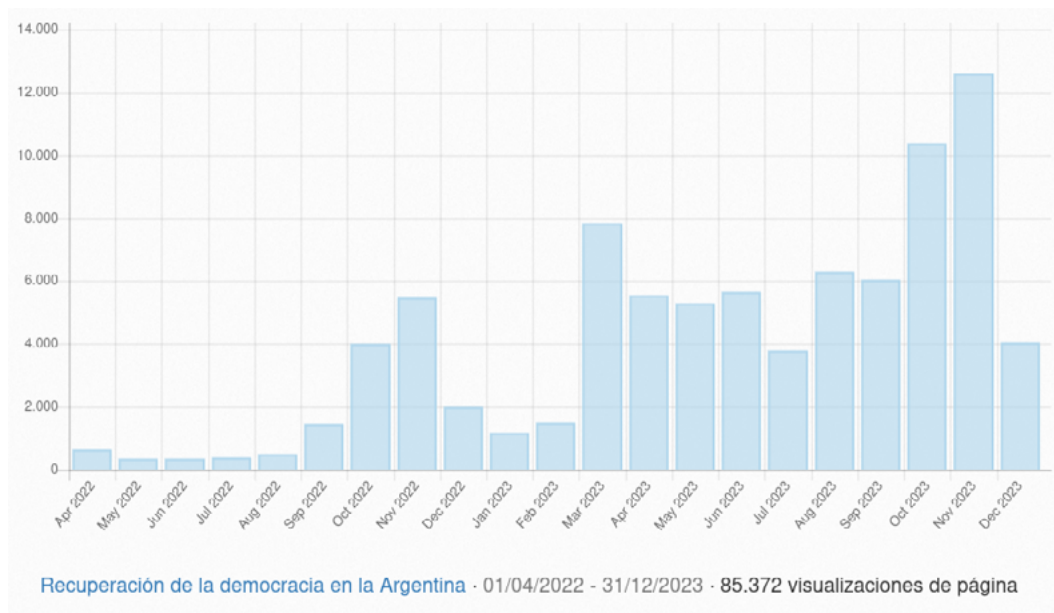
Gráfico 1. Visualizaciones del artículo desde su creación

En cuanto a la historia provincial, se incorporaron hechos relevantes como la creación del programa alimentario PAICOR (en un contexto hiperinflacionario de deterioro de la situación social y laboral), la reforma de la Constitución provincial y sus consecuencias para los actores políticos del momento, entre otros episodios.