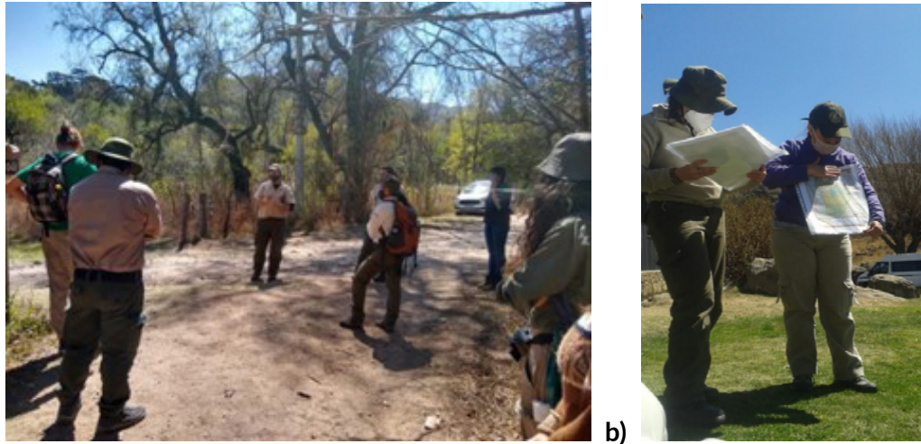
Imagen 1. Actividad de delimitación de especies y zonas de control de especies exóticas vegetales invasoras en a) la Reserva Natural Vaquerías; y b) el Parque Nacional Quebrada del Condorito.