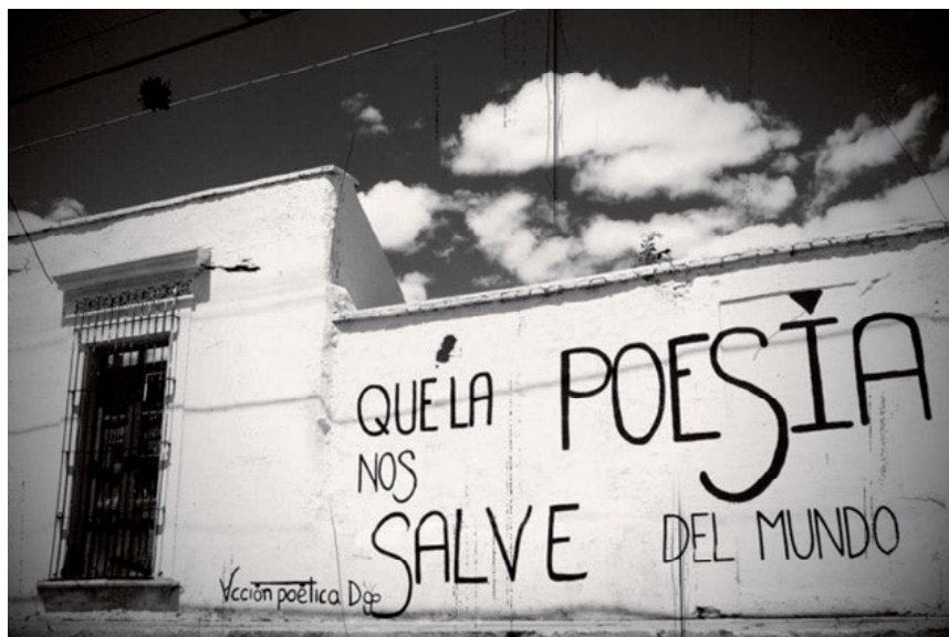
Imagen 1. “Acción poética” Imagen tomada de la web

Marcy Schwartz: Lo interartístico es aún más dinámico y diverso que cuando publiqué Invenções urbanas . Con la explosión de nuevos medios y ámbitos de lo visual y lo sonoro, y en correspondencia con el acceso más abierto y libre a ellos, la interacción de lenguajes (uso aquí “lenguajes” en el sentido más amplio posible) y de prácticas de lectura y de recepción se hacen cada vez más complejas. Solo tomando como ejemplo las publicaciones académicas en el campo de estudios culturales, observo que las revistas son cada vez más accesibles en línea y permiten insertar en ellas videoclips de performance y de música, fotografía y formas gráficas, antes más limitadas, si no impensables, en una publicación en papel. Las posibilidades de creación y de expresión cultural se renuevan y se reinventan continuamente. Entonces, la producción que generan implica nuevas metodologías y acercamientos. Tomando como ejemplo la narrativa y la poesía interactiva digital (que he analizado en mi artículo “Beyond the Book: New Forms of Women’s Writing” de 2016), podemos decir que actualmente se transforma el rol del lector y de la audiencia auditiva (en textos con un elemento sonoro) también. Toda la teoría de la recepción se tiene que ajustar a este nuevo y más amplio paisaje discursivo.