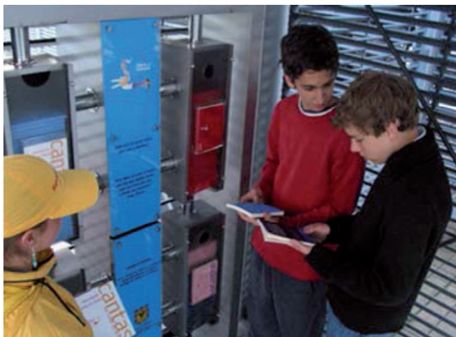
Imagen 6. “Libro al Viento”

Lo que queda por estudiar son más programas de esta índole y trazar su apoyo, financiación y alcance. Mi investigación para este libro se centra en lo urbano y me parece que hace falta estudiar también prácticas de lectura en contextos rurales y periféricos. Además, me parece muy importante reconocer y destacar las editoriales independientes, ferias y talleres de libros artesanales, trayectorias e itinerarios de la lectura literaria en la pospandemia, en la era posneoliberal, en las políticas públicas y en las experiencias a nivel de lectores en distintos contextos y generaciones.