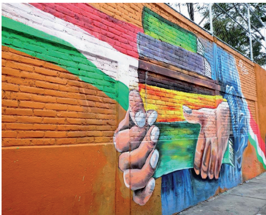
Imagen 8. Mural en la Ciudad de México.

Relacionado con lo que esbozo aquí, creo que las Humanidades Públicas tienen mucha fuerza y urgencia. Son proyectos y líneas de estudio que traspasan los recintos académicos y se extienden a otras esferas como bibliotecas públicas, colegios, museos, parques, cines, plazas, festivales, manifestaciones en las calles, murales y otras formas de arte público. Otros acercamientos muy relevantes desde las “teorías del afecto”, los “estudios de cultura material”, la “ecocrítica”, los “estudios de género y de raza”, y las “críticas a la colonialidad” (desde la perspectiva de culturas y lenguajes indígenas y lo decolonial) cobran mucha importancia en las indagaciones sobre literatura y cultura. Lo interdisciplinario es fundamental para acercarnos a la cultura y la literatura, ampliamente concebidas, y el campo de los estudios urbanos implica siempre dialogar entre múltiples disciplinas.