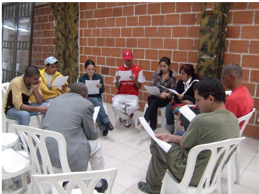
Imagen 7. Sesión de “Gente y Cuentos”, programa de lectura y discusión en un centro de rehabilitación de drogas. Bogotá, Colombia.

KV: Por último, vuelvo a una idea tuya. Dices que las ciudades latinoamericanas son lugares donde existe “un amplio espectro de cultura expresiva” (Schwartz, Inventiones urbanas... , p. 162). En ese sentido, me gustaría saber cómo percibes y enseñas en/desde Rutgers University (que es tu lugar de trabajo académico) las ciudades latinoamericanas que “entran” a los archivos, las literaturas y las artes recientes.