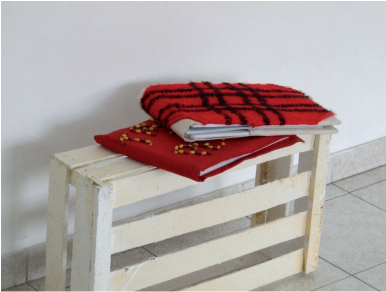
Imagen 3. Olimpo ex-centro de detención. Álbumes de vida. Imagen cortesía de la entrevistada

KV: En el mismo libro del que venimos hablando, te refieres en varias oportunidades a los términos “ciudad” y “espacio urbano”. Teniendo en cuenta ambos términos y observándolos a la luz del propio corpus literario y artístico que analizaste, ¿crees que pueden considerarse “ciudad” y “espacio urbano” como sinónimos?