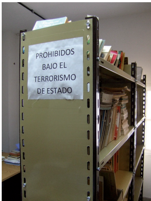
Imagen 2. Olimpo ex-centro de detención. Estante de libros

La cultura cívica en América Latina es un ámbito que he visto acercarse más a lo que entendemos como producción cultural, y no lo digo en un sentido chato o solo burocrático. Durante y después de periodos de violencia política, de autoritarismo y dictadura, de conflictos armados varios, y en el contexto de desigualdad socioeconómica tan profunda (sobre todo desde la implementación de políticas neoliberales en gran parte de la región), se generan imaginarios muy diferentes. Las ciudades y sus espacios siguen participando en y generando narraciones, ficciones, testimonios, murales, memoriales y motivan conversaciones compartidas ampliamente. En el contexto de los nuevos medios comunicativos y de diseminación, el público lector es menos pasivo ya que se ha expandido su agencia como usuario y también como creador de su propio contenido y de sus propias redes.